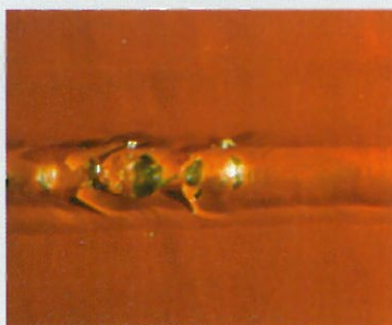
Laminado fibra de vidrio