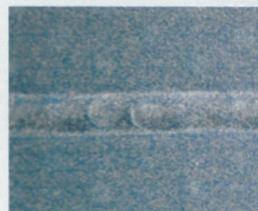
TACMASTER BLUE impregnación especial anti-abrasión.